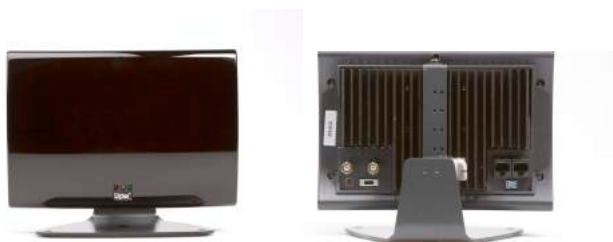
LA-140 Stationärer Strahler