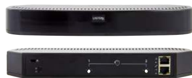
LA-141 ListenIR Erweiterungsstrahler