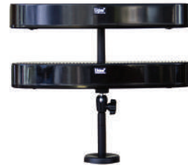
LT-84 und LA-141 inklusive Montagesatz