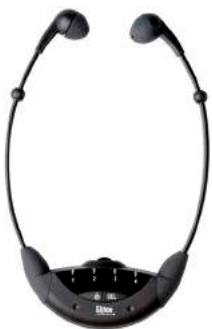
LR-42 IR Stethoskop 4-Kanal-Empfänger