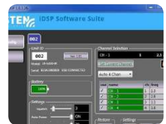
Die Listen iDSP Software Suite