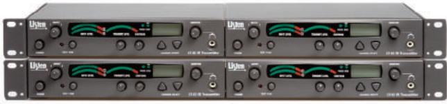
LT-82 mit Rackmount