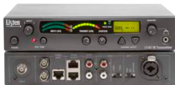
LT-82 Stationärer Infrarot-Sender